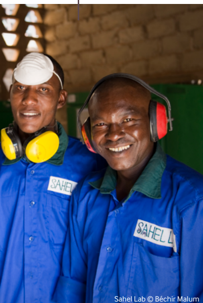
Sahel Lab © Béchir Malum

Objectif : Apporter un soutien stratégique aux structures d'appui à l'entrepreneuriat (incubateurs, accélérateurs, etc.) dans les pays cibles du programme.