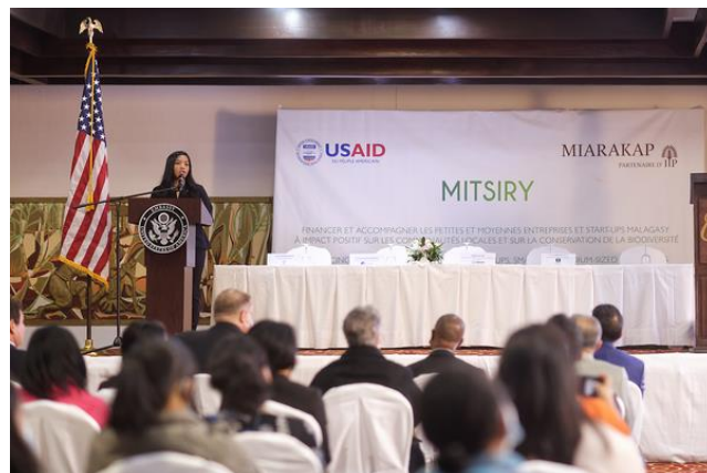
Lancement de Mitsiry (Mai 2022)

Le programme cible plusieurs secteurs dont l'agriculture, l'apiculture, l'aquaculture et l'agroforesterie. L'appui aux agriculteurs locaux et l'amélioration des pratiques vers plus de durabilité sont des impacts forts du programme.