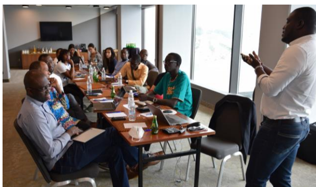
Lancement de SAIS PPI à Abidjan (Mars 2022)

Le programme de préparation à l'investissement pour les start-ups numériques dans le secteur agro-alimentaire (SAIS PPI) a été initié par la Deutsche Gesellschaft für Internationale Zusammenarbeit GmbH (GIZ) et mis en œuvre par I&P Conseil et Comoé Capital.