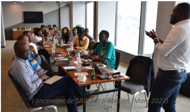
Lancement de SAIS PPI à Abidjan (Mars 2022)

Le programme de préparation à l'investissement pour les start-ups numériques dans le secteur agro-alimentaire (SAIS PPI) a été initié par la Deutsche Gesellschaft für Internationale Zusammenarbeit GmbH (GIZ) et mis en œuvre par I&P Conseil et Comoé Capital.