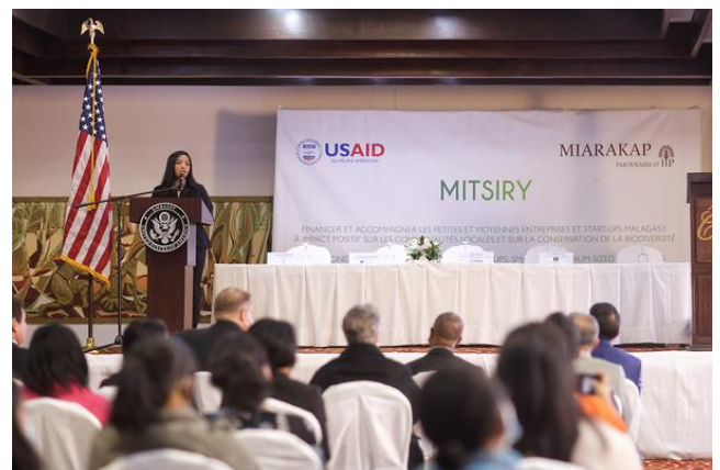
Lancement de Mitsiry (Mai 2022)

Le programme cible plusieurs secteurs dont l'agriculture, l'apiculture, l'aquaculture et l'agroforesterie. L'appui aux agriculteurs locaux et l'amélioration des pratiques vers plus de durabilité sont des impacts forts du programme.