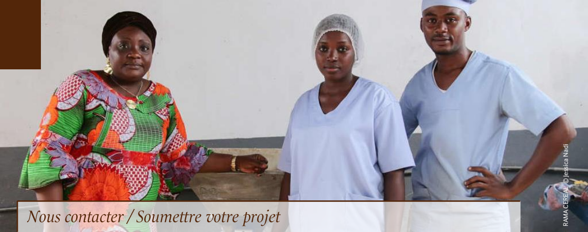
RAMA CEREAL